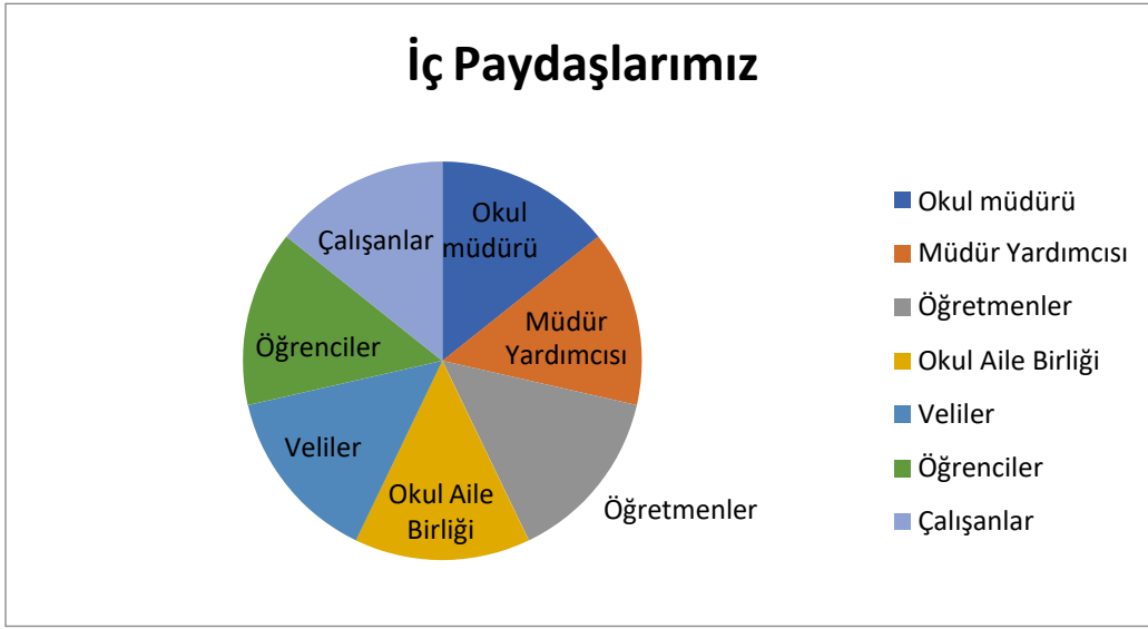
Tablo 7. Memnuniyet ifadeleri